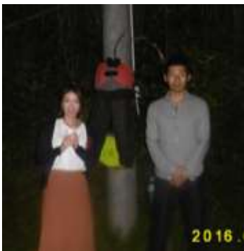
東京からのカップル