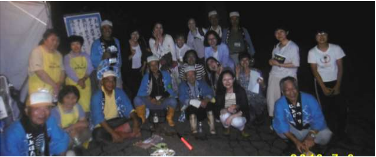
最後のお客さんとスタッフで