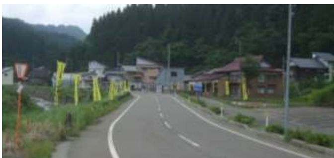
駐車場とのぼり旗