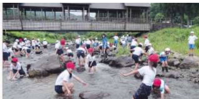
保倉川で生き物調査