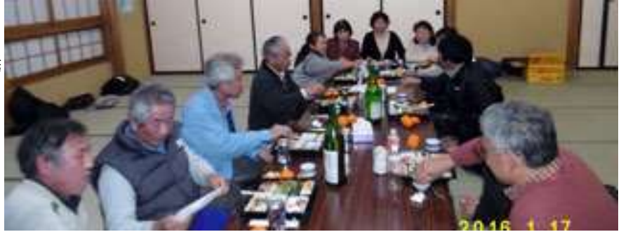
新年会を兼ねたスタッフ会議