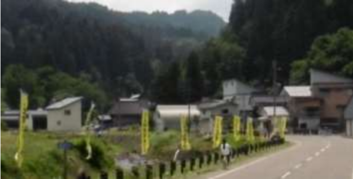
道路沿いののぼり旗

ほたる公園のホタルは数を増していない。50匹くらい。 増えないのはまつり前なので喜んで良いのか、これで終わりなのか、 期待と不安が交差しています。 ただほたる公園以外でも農免道路沿いに何カ所か、数匹の発生が確認されたので、 ほたる公園もこれからの大量発生が期待されます。