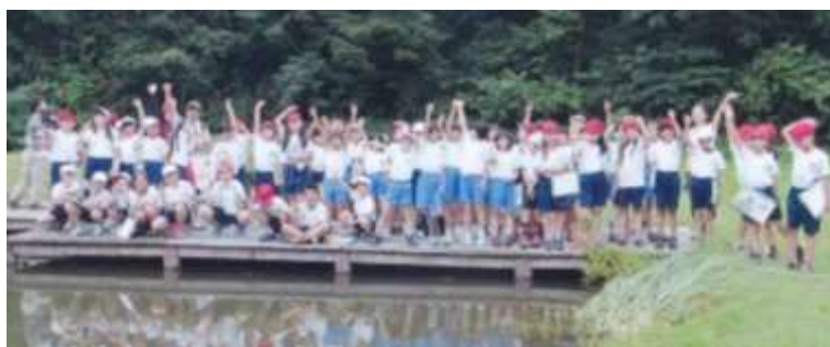
ほたる公園八つ橋の上で