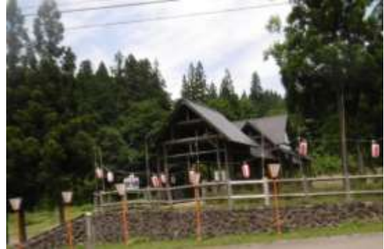
ほたる橋の提灯と灯籠