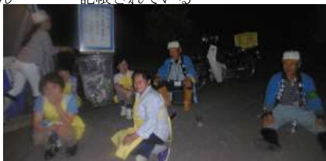
今日も無事に終わりほっと一息