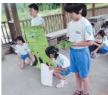
ホタルの話を大島小