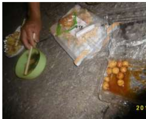
サービスのキュウリと子芋の煮つけ