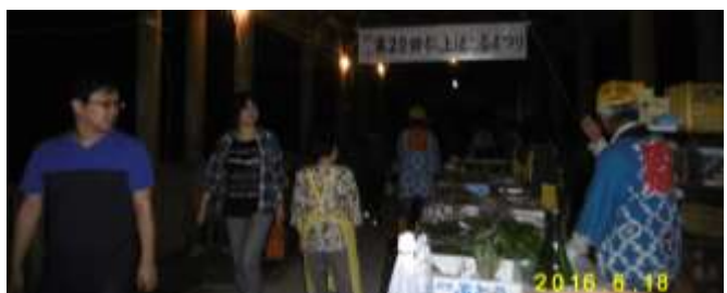
ほたる橋のお客さんの様子

大変美しいホテル、ありがとうございます。昭和町 ホテルを子供に見せてあげることが出来、うれしかったです。ありがとうございました。 頸城区 ほたるをつかまえることができました。うれしかったです。東雲町 かわいかったです。東雲町 10年ぶりに来ました。子供達に見せたくてきました。楽しみです。安江 月の明かりが大きくて、少し残念でした。ホテルは美しかったです。茨城つくば市 子供達に自然に光るホテルを見せてあげられて良かったです。西本町 ガイドの方の説明がとても興味深くわかりやすかったです。満月の中でしたがとてもキレイ に見られました。藤塚 ヘイケボタルが小さくちかちかかわいかったです。また来年も来ます。黒井 初ホテル それより光る いずみかな 北城町（愛の告白？） 民の友乱。広島市中区 今シーズン1回目。また何度も来ます。下源入 ホテルが少なくてちょっと寂しかったです。皆様のおもてなしがとても良くて良かったです。 安江 休んでいても会議をしている様でかわいかったです。また来週来ます。南本町 毎年楽しみにしています。今年は少ししか見られず・・・もう1回来ます。安江 去年に続き2回目です。毎年楽しみにしています。ありがとうございました。長野松本市 キレイでした。また来ます。国府