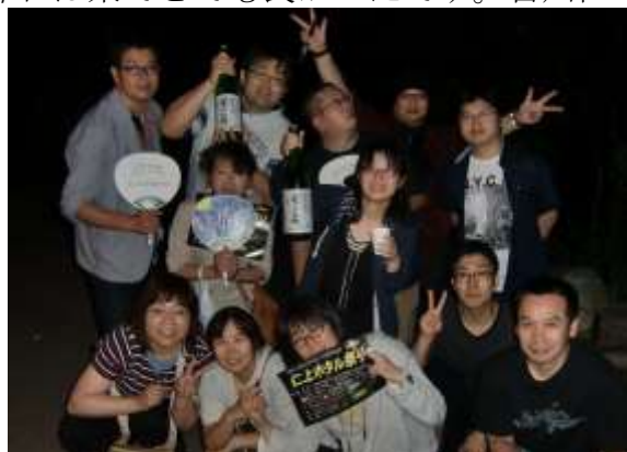
上越ヒマ人会参上。