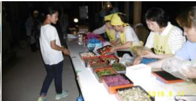
サービス開始直前の重箱料理

今年も来ました。地元の温かい心遣いに感激です。新潟市中央区すばらしい光でした。 仁上の皆様ありがとうございます。大島小の子供もお世話になります。重箱おいしかったです。頸城区