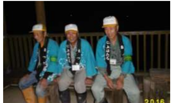
お客さん待ちのスタッフ