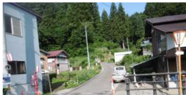
ほたる見台入り口