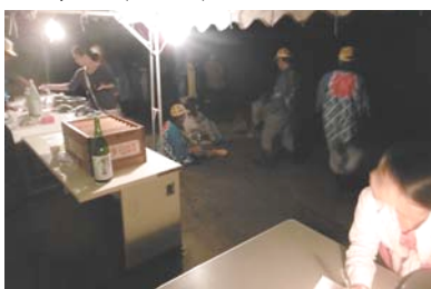
詰め所前で星座の説明も