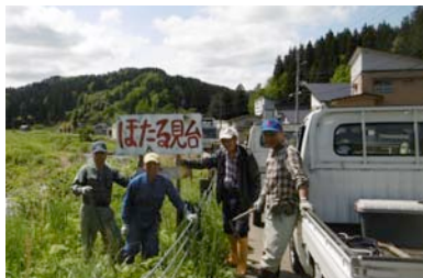
ホタルの案内看板を立てる