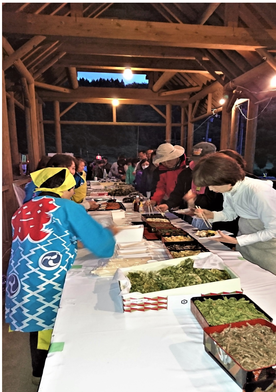
初日の重箱料理のおもてなし