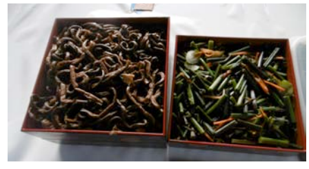
サービスの山菜料理 ウド、蒨、竹の子、ワラビ、ゼンマイ