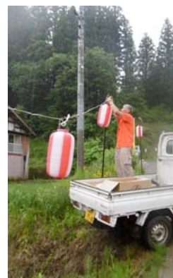
ほたる橋撤収完了