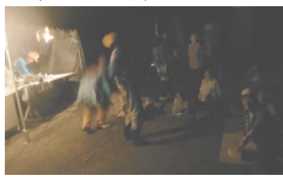
今年初めてのホタル談義の始まり