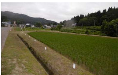
明るいときのあぜ道アート