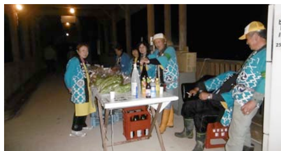
大勢のお客さんでちょっと疲れ気味