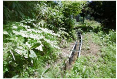
改修したホタル水路