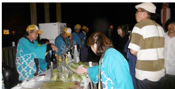
ささやかな売店も賑やかに