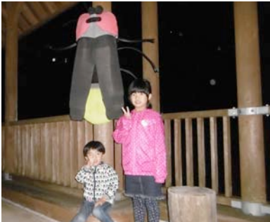
お姉ちゃんと仲良く