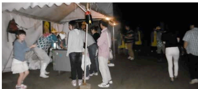
詰め所前にぎわいの様子