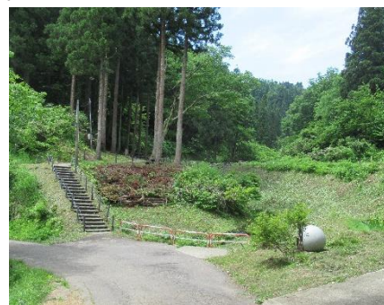
すっきりしたほたる見台