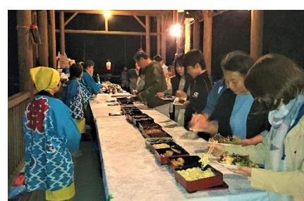
バイキング方式で