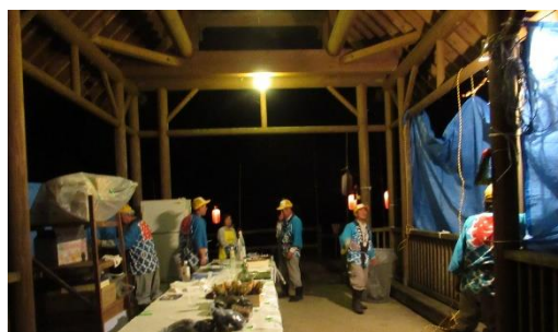
あまりの寒さにシートで風よけを