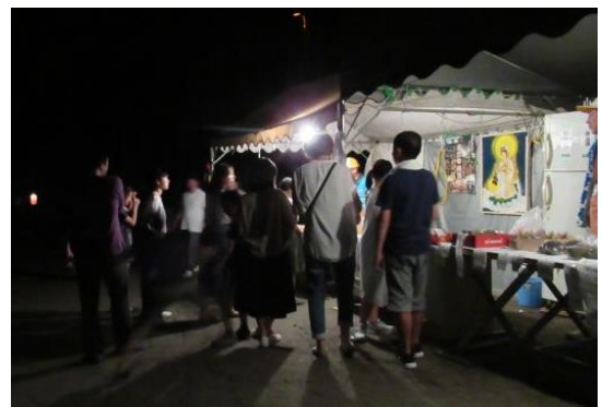
家族ずれとの談笑を楽しむスタッフ