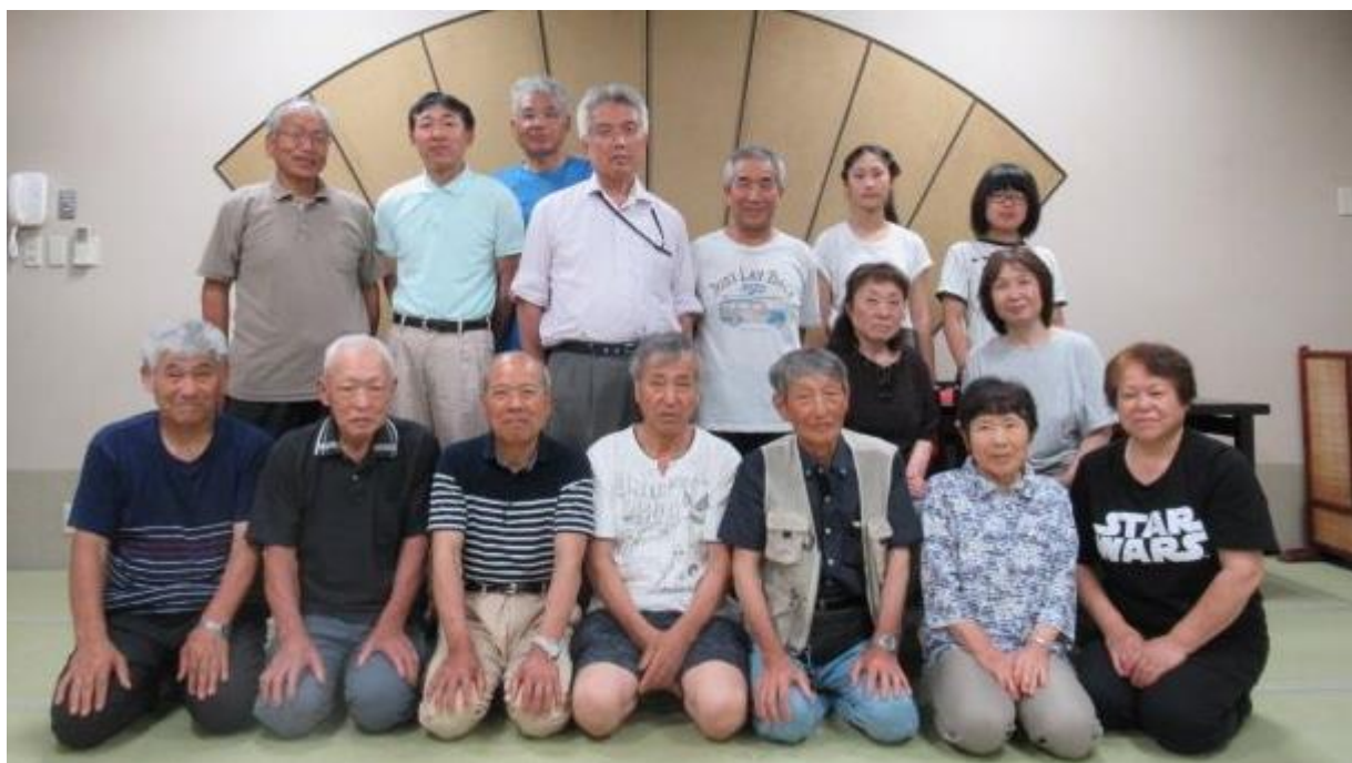
私達が案内しました