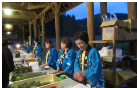
接待の母ちゃんたち