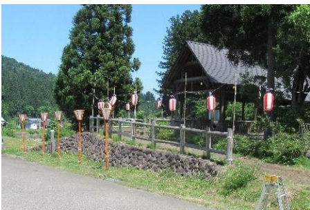
ほたる橋に提灯、灯籠

明日は朝8時からスタッフ全員で、まつり準備の最終確認作業を行います。 例年期待されている重箱に詰める料理の準備もお母ちゃん達が進めています。 会員の母ちゃん以外にも町内に声をかけ重箱の数を増やすよう心がけています。ご期待下さい。