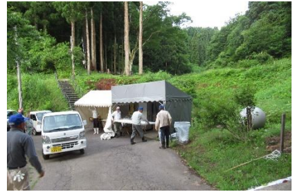
スタッフ全員でほたる橋を撤収後ほたる見台へ移動 棚田アート