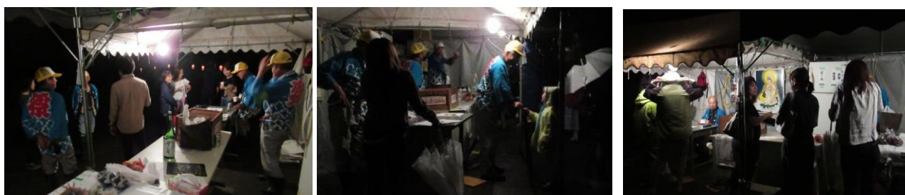
今年最後のお客さんとのふれあいトークを楽しむ