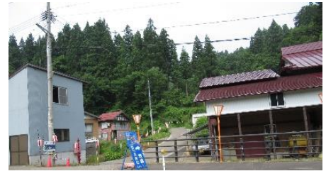
ほたる見台入り口に設置したピンクのトイレ 中もピンク