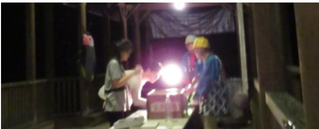
ささやかな売店の様子

ほたる見台も数を増しています。たくさん飛んでくれることを期待して、23日以降が楽しみです。