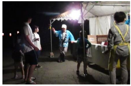
詰め所テントの前