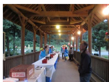
お客さんを待つスタッフ