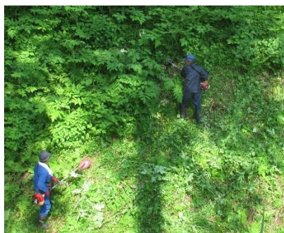
ほたる見台草刈り