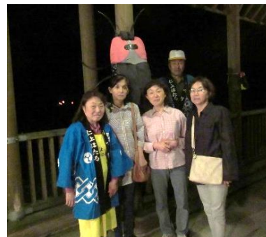
安塚の美女とスタッフ