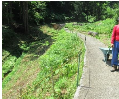
ほたる見台に安全柵