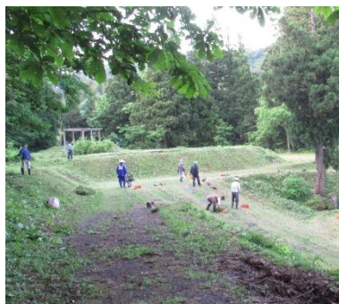
公園草刈りボランティア