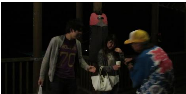
蛍の舞でホテルに乾杯

◎おじいちゃんもホテルもお酒も最高でした。夜遅かったのにありがとうございました。また来ます。上教大